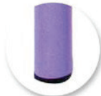
Embout non tachants et non marquants (polyéthylène).