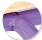
Soudure haute résistance avec aj port de métal