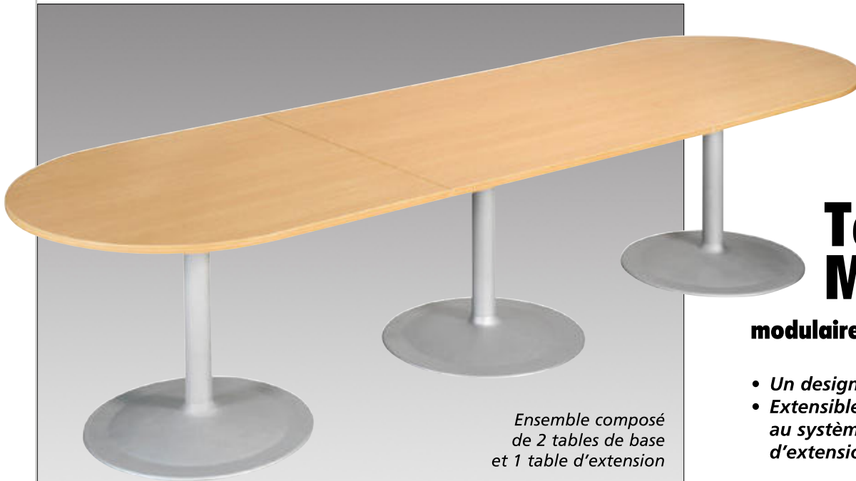
Ensemble composé de 2 tables de base et 1 table d'extension