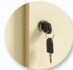
Serrure 1 point