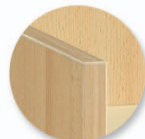
Chants polypropylène (PP) de 2 mm