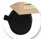
Roulettes double galets