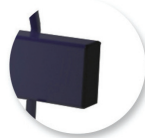
Embout bout de tube