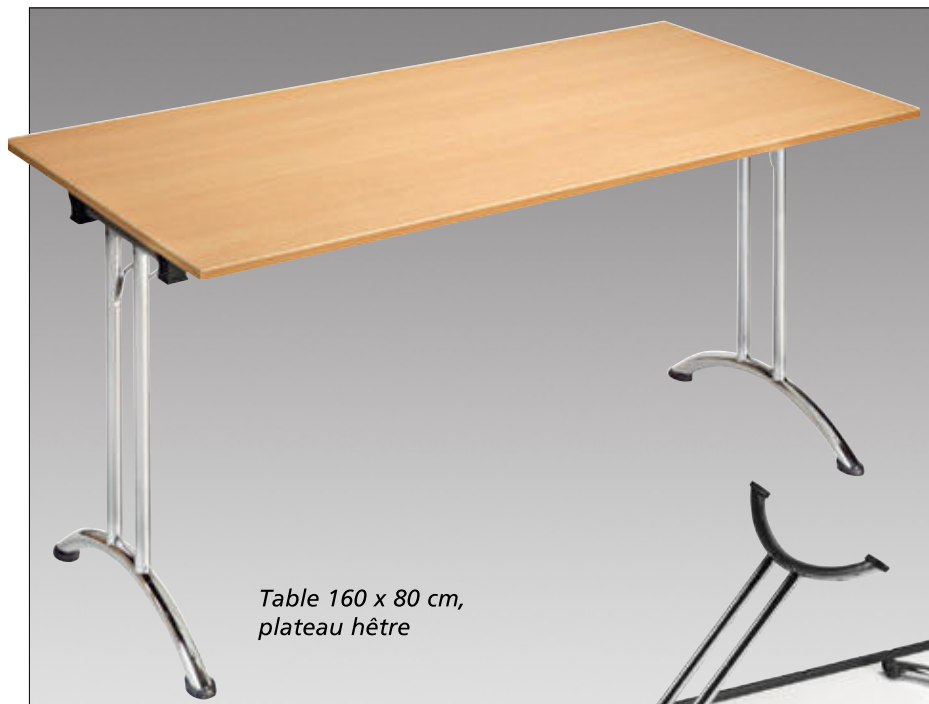
Table 160 x 80 cm, plateau hêtre