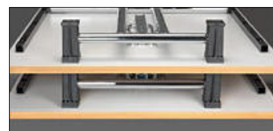
4 butées pour empilage des tables