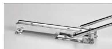
Clipsage de sécurité en position ouverte et fermée