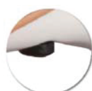
Butée appui sur table + protection angle du plateau de table