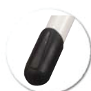
Embouts non tachants et non marquants (polyéthylène).