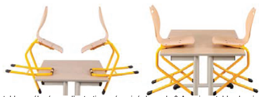
Appui sur table surélevé pour l'entretien mécanisé des sols & Appui sur table classique pour le passage du balai