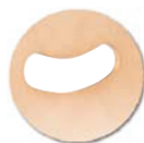
Prise de main; manipulation facilitée

Ne pas utiliser: Solvant cétonique; Pâtes et crèmes abrasives; Détergents (ne pas gratter).