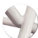
Soudure haute résistance avec apport de métal