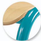
Soudure haute résistance avec apport de métal