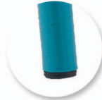
Embout non tachants et non marquants (polyéthylène).