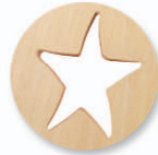
Prise de main; manipulation facilité