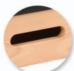
Prise de main; manipulation facilité