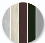
5 coloris disponibles