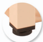
Vérins de réglage