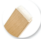
Embouts non tachants et non marquants (polyéthylène).