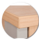
Chants polypropylène (PP) de 2 mm