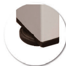
Vérins de réglage