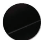
Coloris noir 9005 uniquement.

Ne pas utiliser: Solvant cétonique; Pâtes et crèmes abrasives; Détergents (ne pas gratter).