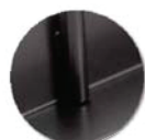
Soudure haute résistance avec apport de métal