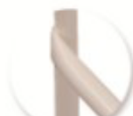
Soudure haute résistance avec apport de métal