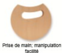
Prise de main; manipulation facilitée