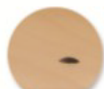
Fixation Vis TRCC et écrou.