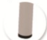
Embouts non tachants et non marquants (polyéthylène).