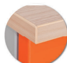
Chants polypropylène (PP) de 2 mm