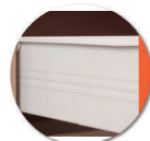
Tiroir sur glissière métalliques

Ne pas utiliser: Solvant cétonique; Pâtes et crèmes abrasives; Détergents (ne pas gratter).