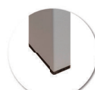
Embouts non tachants et non marquants (polyéthylène).