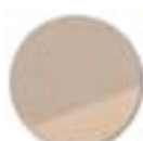
Sommier panneau aggloméré ép.: 19 mm.