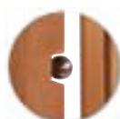
Système d'ouverture sécurisé