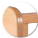
Structure en hêtre massif.