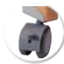
Roulettes double galets