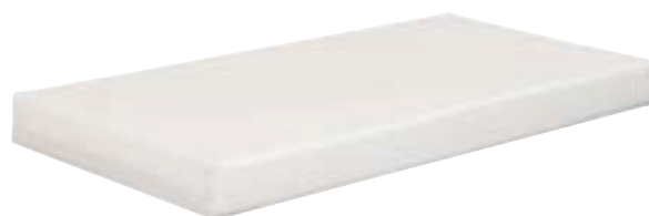
Options: Matelas 118x58x10; housse PVC blanc; 200g/m2. (S383000ZZZZ-01)