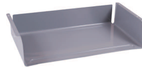
(Option : casier tôle à visser noir 9005).