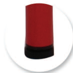
Embout à talon, non tachant, non marquant (polyéthylène).