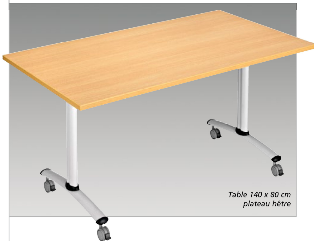
Table 140 x 80 cm plateau hêtre