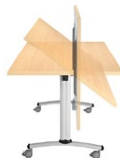
Installation ultra simple, rapide et sans effort