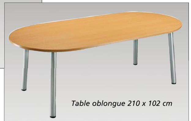
Table oblongue 210 x 102 cm

Larges plateaux et piètements élégants pour des tables de réunion conviviales