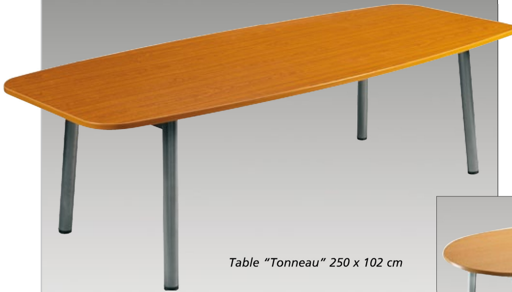
Table "Tonneau" 250 x 102 cm